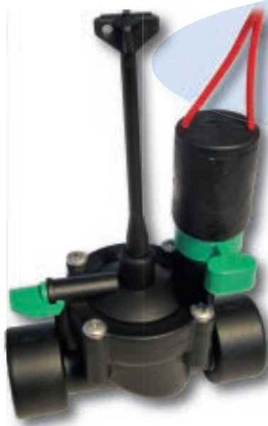
Tableau pertes de charge (bar)*